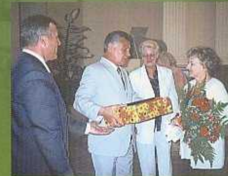
Führung für die "Brücke nach Kiew" durch Kiewer Oberbürgermeister Omeischtschenko

Wir arbeiten nach dem "Eins zu eins-Prinzip": Jede Spende gelangt direkt und ohne Abzüge nach Kiew. Außerdem werden die Empfänger kontrolliert und nur so lange unterstützt, wie es unbedingt nötig ist.