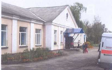
Mittagessen im Waisenhaus

Waisenkinder und Kinder aus verarmten Familien finden ein Zuhause und werden mit Essen versorgt